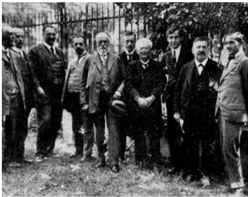
Die Kongreßteilnehmer des Sexualreformkongresses 1921 im Garten des Instituts für Sexualwissenschaft : Hirschfeld 2. v. r., Hiller links dahinter (?)

Ein deutscher Kaiser, dem auch der Republikaner die Achtung nicht versagen wird, die ein freigesinnter und gütiger Mensch verdient, hat den Antisemitismus die Schmach seines Jahrhunderts genannt. Aber wann je sind in Deutschland Juden so verfolgt worden wie Homoerotiker? Weist das Strafrecht etwa eine Ausnahmebestimmung gegen jene rassoide Minderheit auf, wie es die berüchtigte Ausnahmebestimmung gegen diese sexuelle Minderheit kennt? Die Schmach des Jahrhunderts ist der Antihoerotismus ; die Schmach des Jahrhunderts ist der Paragraph Einhundertfünfundsiebzig.